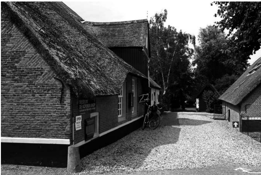
MUSEUM DE KOPEREN KNOP HARDINXVELD-GIESSENDAM