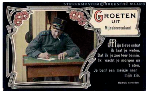
EEN ANZICHTKAART MET EEN GROET UIT MIJNSHEERENLAND. DE TEKST LUIDT: