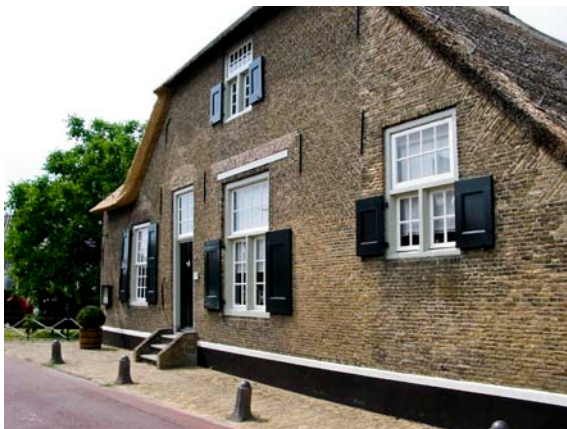
MUSEUM DE KOPEREN KNOP HARDINXVELD-GIESSENDAM

Ter verduidelijking voor de nieuwe vrienden: jaarlijks wordt er een bijeenkomst georganiseerd. Deze bestaat uit een middagprogramma binnen of buiten de Hoeksche Waard en een avondprogramma, bestaande uit een bezoek aan Party-Centrum "De Vijf Schelpen" in Mijnsheerenland. Hier gebruiken we de maaltijd die, zoals ieder jaar, bestaat uit een driegangenmenu en de keuze tussen erwtensop of spek met peren.