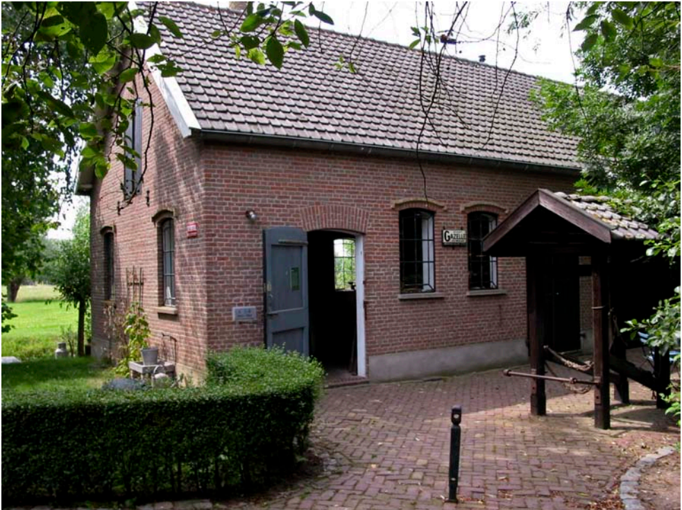
MUSEUM DE KOPEREN KNOP, DE SMEDERIJ, HARDINXVELD-GIESSENDAM

Alle bedragen zijn per persoon en kunnen overgemaakt worden op rek.nr. 38.70.852 van "Stichting Vriendenkring v.h. Streekmuseum" te Heinenoord onder vermelding van het aantal personen en de menukeuze, nl. erwtensoep of spek met peren. Introdúcés zijn welkom.